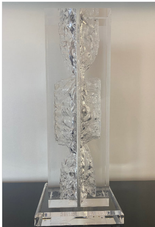
Ice Candy Block

Apparues en 2015, les sculptures Ice Candy marquent une nouvelle étape dans la recherche de l'artiste autour de la matière et de la lumière, explorant transparence et effets de réfraction. Taillées dans du plexiglas massif au marteau et au burin puis polies jusqu'à obtenir une finition proche du verre.